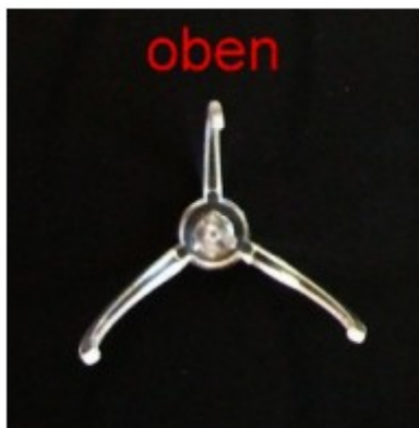
Idealstellung der Spezialhalter